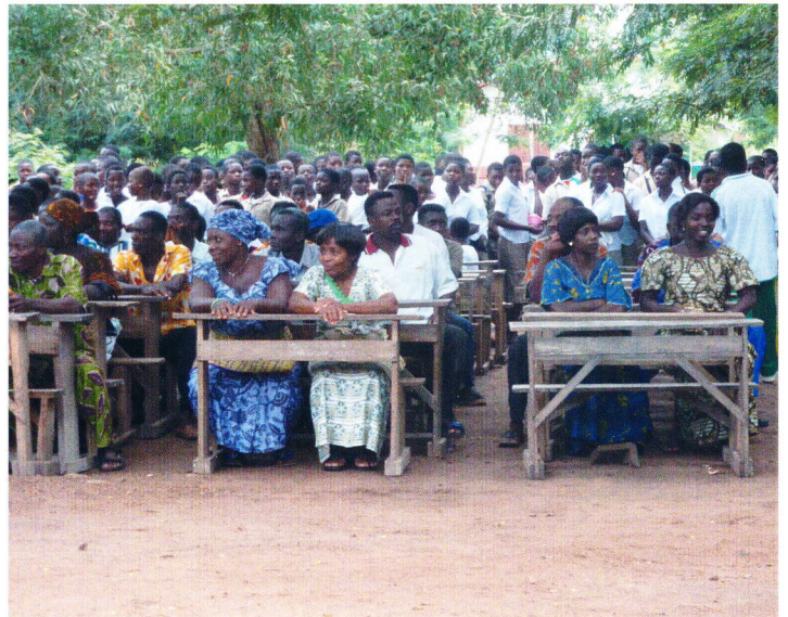
Elternvertreter und Schüler