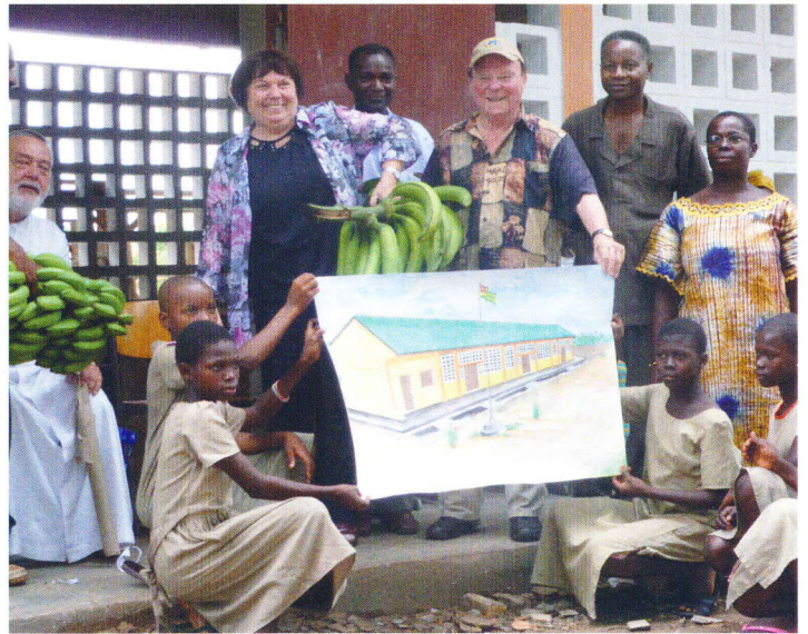
Geschenke der Grundschule