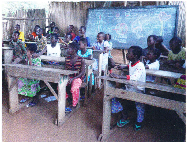
Fotos 2009: Zwei der bisherigen Klassenräume der Grundschule in Hanyigba-Duga

Diesen Kindern und Lehrern steht heute ein wunderbarer Neubau zur Verfügung. Zudem wurde die Schule auch mit Schulbüchern für alle Klassen und weiterem Schulmaterial ausgerüstet. Früher hatte nur der Lehrer ein Buch zur Hand und die Vermittlung ging über die Wandtafel.