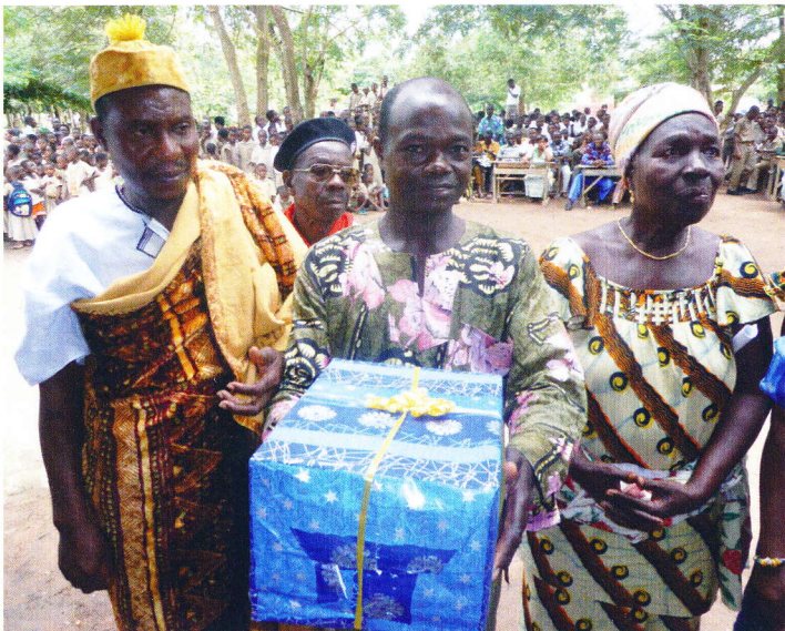
Geschenke der Gemeinde