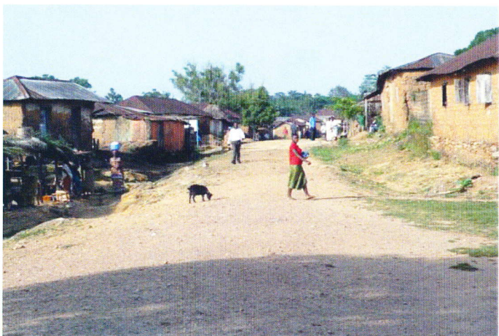
Dorfstraße von Hanyigba-Todzi

Im Jahr 2002 konnten wir in diesem Dorf die Einweihung der von Grund auf renovierten allgemeinen Grundschule und der neuen katholischen Grundschule, unserer „ Overbergschule “ feiern.