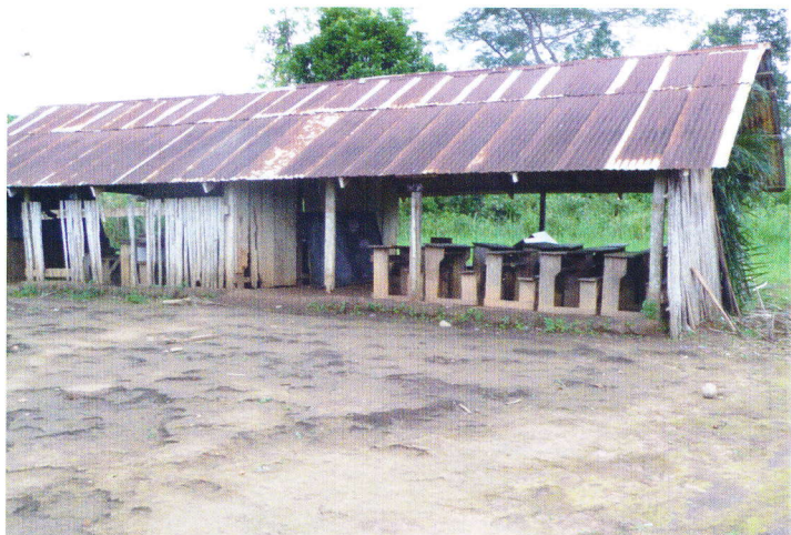
Eines der zwei Schulgebäude.

Wie wir sahen, gibt es im Umfeld noch eine weitere allgemeine Realschule , und zwar hoch in den Bergen, in Hanyigba-Todzi , die dringend ersetzt werden müsste.